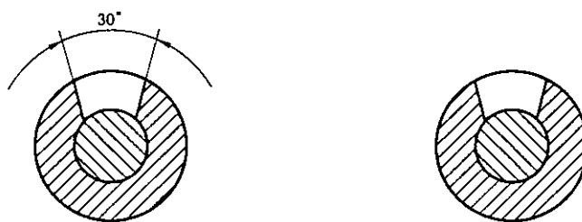
图 D.2 试样

d) 在已剥去绝缘层的中间位置处的该层粘接带上,用一根热针穿刺一个孔,孔的直径应等于最小允许绝缘层厚度的一半。另一根试样用同样方法制备。